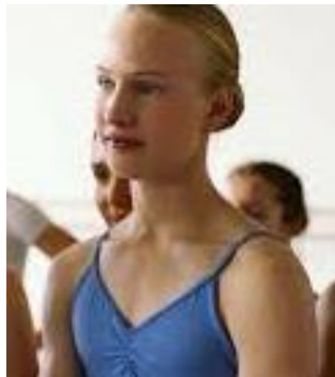
Het leven van een transgender

Girl is de debuutspeelfilm van Lukas Dhont die het scenario schreef samen met Angelo Tijssens. Dhont kwam op het idee toen hij een kort artikel las over een jong meisje dat ballerina wilde worden, maar geboren was in een jongenslichaam. Hij voerde daarna verschillende gesprekken met haar en andere jonge transgenders. De film werd ontwikkeld in het kader van het Résidence du Festival, een initiatief van de Cinéfondation (gelieerd aan het filmfestival van Cannes).